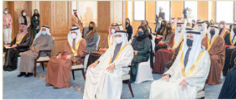
المنامة - وزارة الخارجية

أكد وزير الخارجية عبداللطيف الزباني، أن امتزاز عاهل البلاد صاحب الجلالة الملك حمد بن عيسى آل خليفة، وتمكين ولي العهد رئيس مجلس الوزراء صاحب السمو الملكي الأمير سلمان بن حمد آل خليفة، للجهود الوطنية المخلصة لكافة العاملين في الصفوف الأمامية للتصدي للجائحة فيروس كورونا (كوفيد 19) من الكوادر الصحية، وقوة دفاع البحرين، ووزارة الداخلية، وكافة الجهات المساندة، يمثل دافعا لمواصلة العمل بذات العزم والإرادة على الإسهام في الجهود الوطنية الهادفة إلى حماية صحة المواطنين والمقيمين، مشيدا بجهود الموظفين وحرصهم على أداء الواجبات الموكلة إليهم بكل تقان وإخلاص.