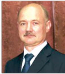
التفاهم مع الشركات التكنولوجية الروسية الرائدة منها (Rosatom) و(Roscosmos) والوكالة الذرية، (Rosatom).

نحن نشارك قلق دول مجلس التعاون بشأن ما يعرف بالخطر الإيراني، سيما ما يتعلق بالبرنامج النووي الإيراني، ونرى أن التغلب على هذا التحدي يتطلب الجهود الدبلوماسية المكثفة على الأصعدة الثنائية، ومنعقدة الأطراف، الرامية إلى تخفيض التوتر في منطقة الخليج، وخلق الظروف المواتية لإطلاق عملية تعزيز الثقة بين دول الخليج وإيران. وفي نفس الوقت نعتبر أن تحقيق هذه الأهداف يتطلب العودة إلى «الصيغة النووية». إن العودة إلى الاتفاقية النووية ستتيح -من وجهة نظرنا- الفرص لخفض التصعيد، وكذلك إقامة التعاون السلمي بين إيران والدول العربية، فنحن متمسكون تماماً أن الحوار بشكله أساس الأولويات فيما يخص تهديد الأوضاع في المنطقة إزاء ما يعرف بالخطر الإيراني، أما التقارب والولف الروسية في هذه اللعبة وسيل تنفيذها، فتنسجمنا رؤية الأمن الجماعي في منطقة الخليج التي طرحها العالم رسمياً بصيغتها المعقدة والحدثة خلال العام الماضي على المجتمع الدولي كنه للائق، بما فيها على الدول العربية.