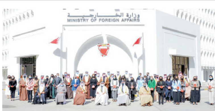
وزير الخارجية عقب تسليم منتسبي الوزارة الوسام.